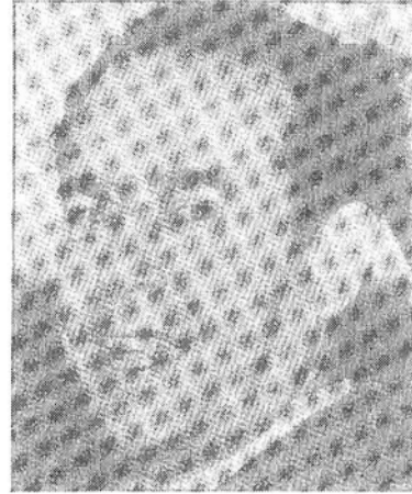
السيد المهدي ابن بركة

وكان من توابع هذا الاعلان العمومي تحرير أحد أعضاء هذا المكتب الثلاثي، وهو المحجوب بن الصديق المحكوم عليه بثمانية عشر شهرا سجنا، بتهمة المساس باحترام السلطة وبخروجه قبل متم هذا الحكم بشهر واحد. وقد احتفل حزب الاتحاد بخروجه من السجن في بورصة الشغل بالدار البيضاء وظهر التقارب الحزبي النقابي في أوجهه ... وأثناء هذا الاحتفال، (ونسجل هذا الحدث بمناسبة وفاة محمد الخامس.) وقع لقاء تاريخي يوم الاحتفال العمالي، وهو فاتح مايو 1968، ما بين عبد الرحيم ابو عبيد زعيم الاتحاد الوطني